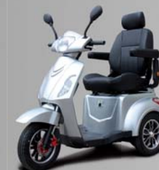
ÉGALEMENT DISPONIBLE EN COULEUR ARGENT