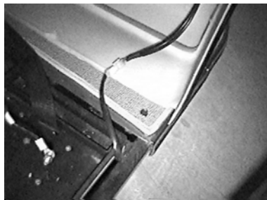
Câble pour les feux arrière