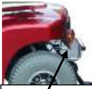
Levier manuel de roues libres

Votre ES400/ES500 est équipé d'un levier manuel de roues libres qui, lorsqu'il est positionné vers l'avant, permet de déplacer le ES400/ES500 manuellement.