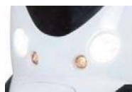
PHARES AVANT AU LED