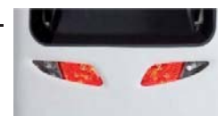
PHARES ARRIÈRE AU LED